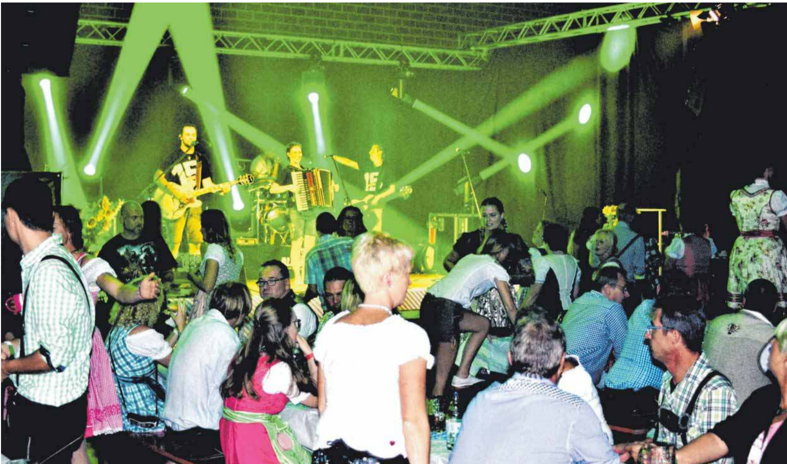
Die Band „Allgäu-Feager“ heizte dem Publikum in der Haisterkircher Festhalle ordentlich ein.