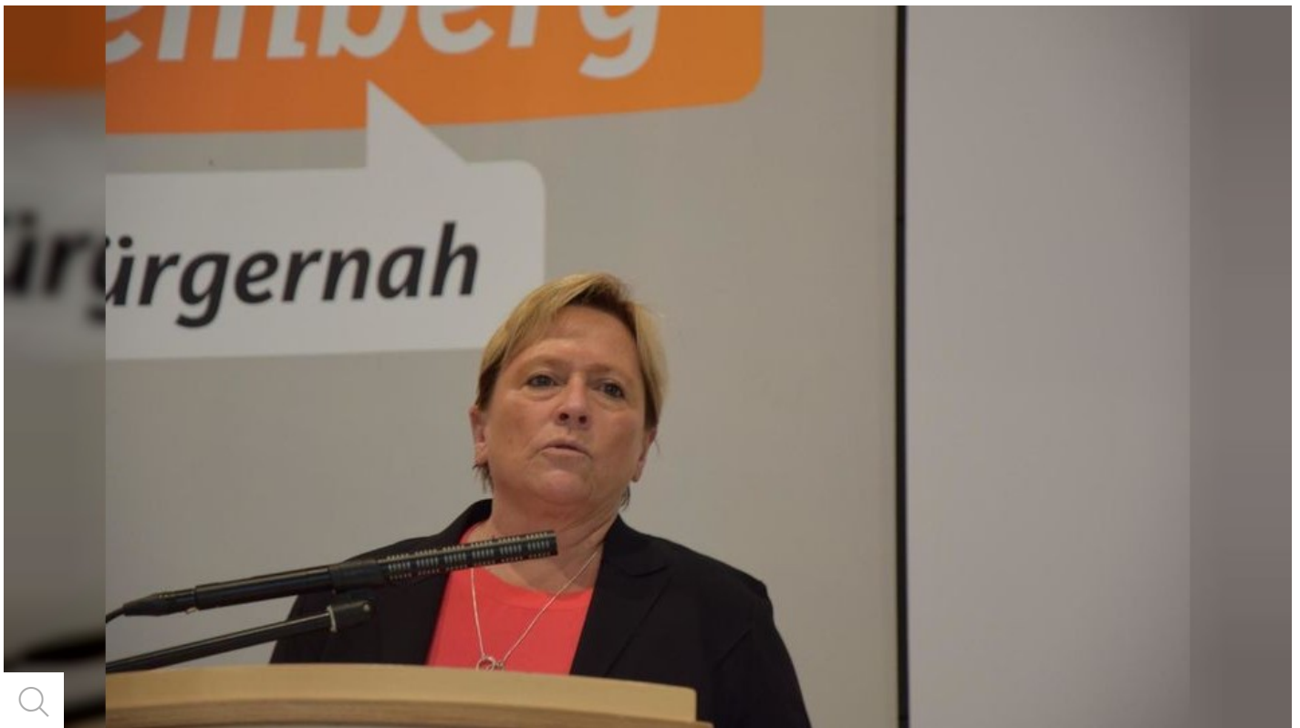
Die CDU-Spitzenkandidatin zur Landtagswahl, Kultusministerin Susanne Eisenmann forderte die CDU-Mitglieder zur Geschlossenheit im anstehenden Wahlkampf auf.