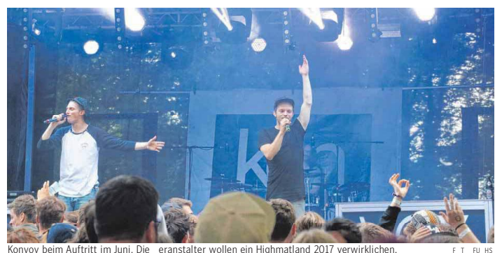
Konvoy beim Auftritt im Juni. Die Veranstalter wollen ein Highmatland 2017 verwirklichen.